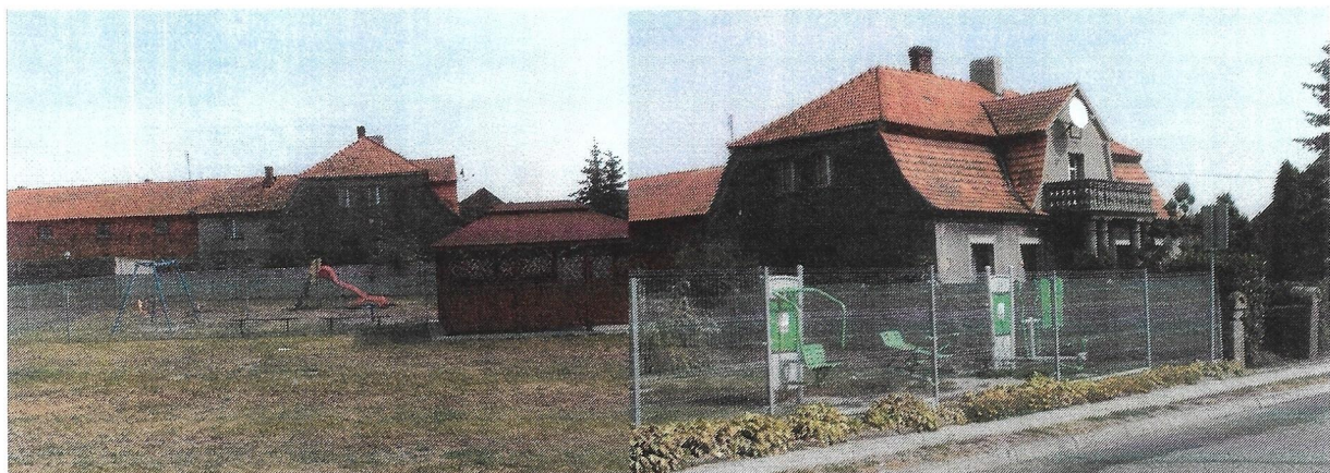
Altana z placem zabaw