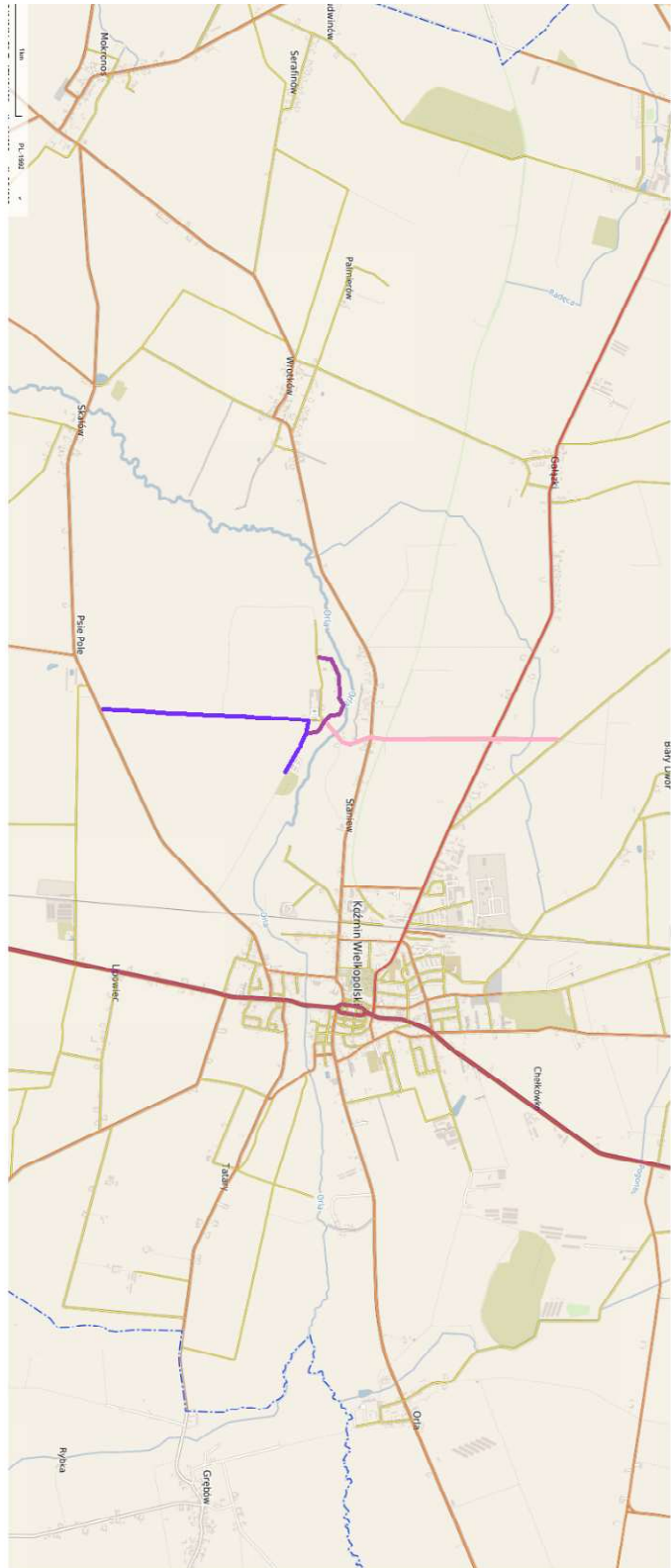
Nowy przebieg dróg gminnych publicznych (cały przebieg)