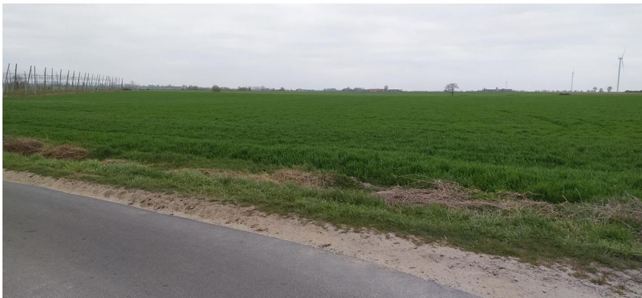
fol.1 Tereny rolnicze w rejonie opracowania planu; widok z drogi prowadzącej do Skatowa